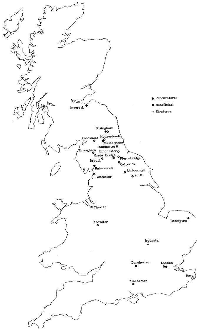
Figura 1.— Distribución del personal administrativo en Britannia