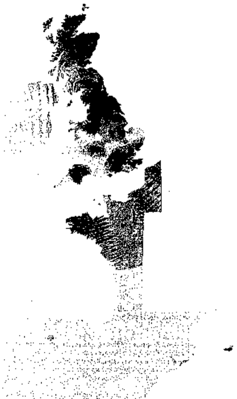
Figura 2.— Interpolación de las densidades de ánforas Dressel 20 en Hispania y Britannia (cgr/m 2 )