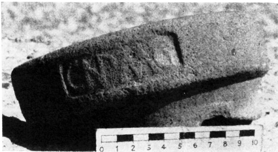
Fig. 1. Foto del sello del ánfora de Torre Valdaliga

existencia del sello CNPMG 3 sobre una ánfora tipo Lamboglia 2, hallada en Torre Valdaliga, Civitavecchia (prov. Roma), conservada en una colección particular, que se consideraba producida durante la época republicana en Apulia. Su foto fue publicada por Gianfrotta 4 (fig. 1).