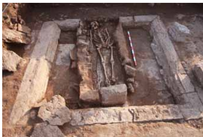
Figura 6. Sector K. Detalle de la tumba SP1282 en el interior del impluvium .

(UE 1260, junto al muro MR 1103; UE 1261 y UE 1262 esta última rellena por el estrato UE 1275, parcialmente excavado) de funcionalidad desconocida.