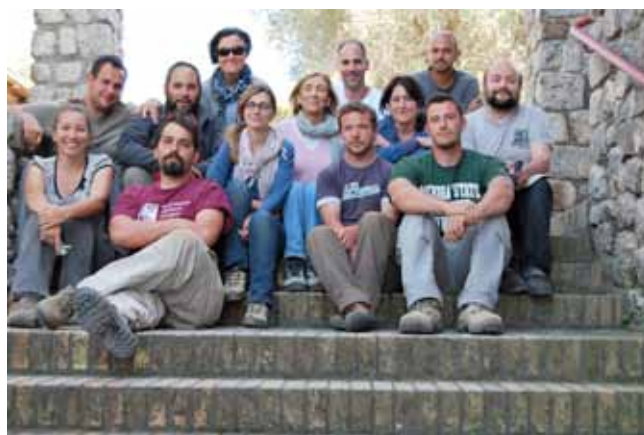
Figura 9. El equipo que ha participado en la campaña de 2010.

de apenas unos centímetros de grosor, muy suelta y de textura arenosa-limosa donde apenas aparecieron restos cerámicos ni materiales de construcción en comparación con las unidades superiores.