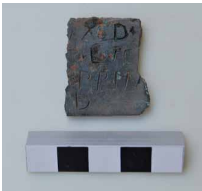
Figura 10. Bronce epigráfico.

En el centro del impluvium se documentó una tumba (SP1282) formada por piedras de diverso tamaño (UE1284), algunas de las cuales habían formado parte del borde de aquel, dispuestas en posición