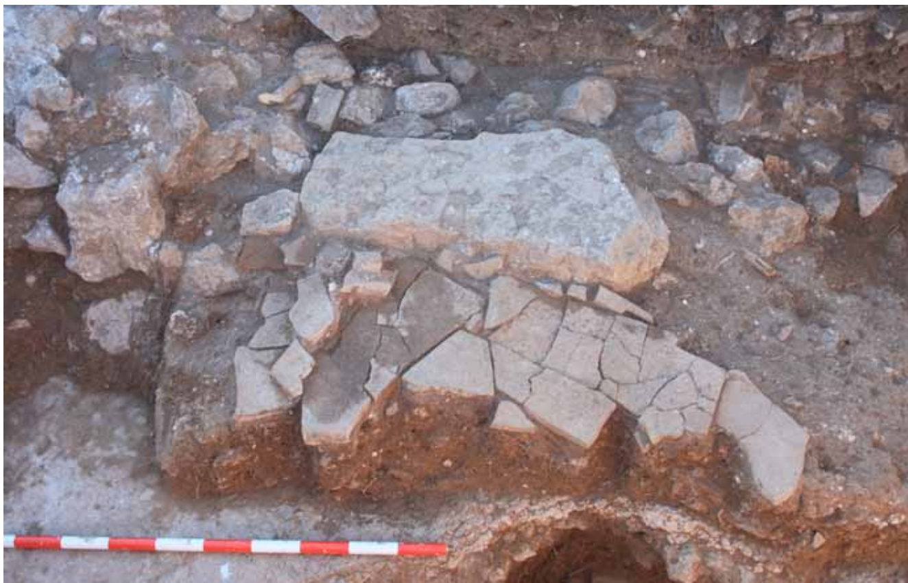
Figura 3. Sector A. Detalle del nivel de abandono (UE 1271) sobre el pavimento del peristilo.

to de opus signinum (UE 1302) y también rellenaba la UE negativa 1276, correspondiente a un recorte del citado pavimento. En los extremos NE y SO del recorte (UE 1276) se habían conservado restos de un estrato republicano (UE 1280) relacionado con la construcción de dicho pavimento. Este estrato es igual a la UE 1168, identificada en la campaña de 2009 en el sector del peristilo adyacente al criptopórtico, que proporcionó abundante material de época tardorrepública.