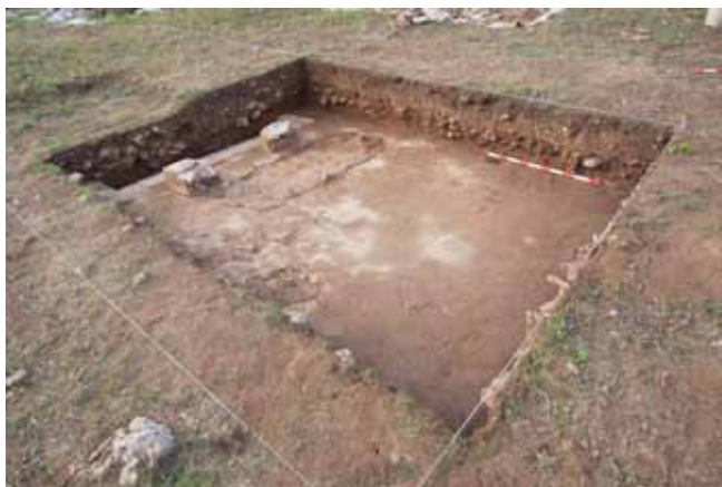
Figura 5. Sector K. Vista general del centro del atrio. Se aprecia el derrumbe que cubre el nivel de abandono y en la parte izquierda, se puede observar ya el borde del impluvium .