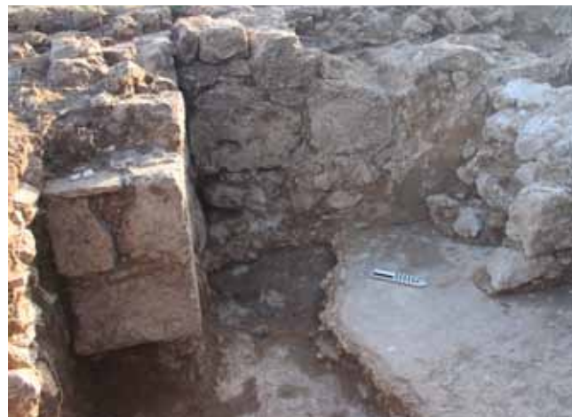
Figura 2. Sector A. Detalle del muro con revestimiento de estuco pintado. A la izquierda, jamba de la puerta de comunicación entre la casa y el peristilo.