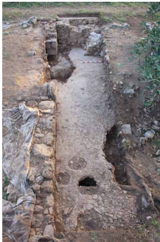
Figura 1. Vista general del Sector A.

La parte noreste de dicho derrumbe, correspondiente a la UE 1257, estaba situada sobre el pavimen-