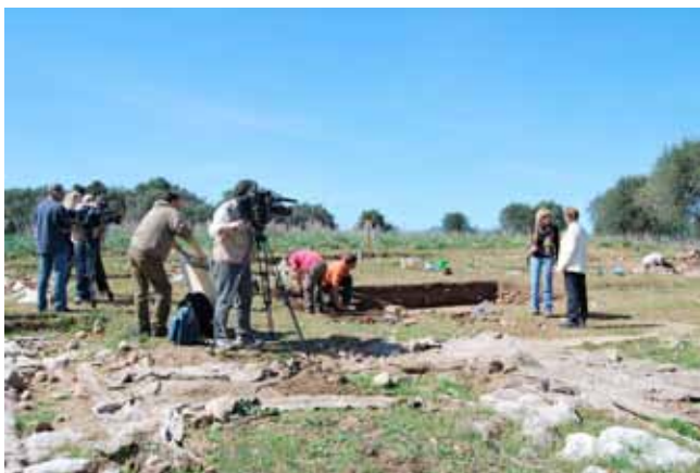
Figura 8. La cadena de televisión nacional italiana RAI visita el yacimiento.