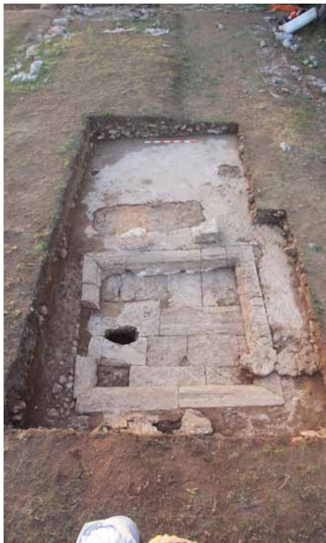
Figura 7. Sector K. Vista general del impluvium una vez retirada la tumba SP1282.

En la zona excavada correspondiente al sector K se documenta el impluvium de la domus. Una vez excavado el nivel superficial (UE 10020 y 10021) se documentaron dos estratos (UE 1247 y 1273) compuestos de una matriz de tierra de color marrón oscuro con presencia de pequeñas piedras, restos muy alterados