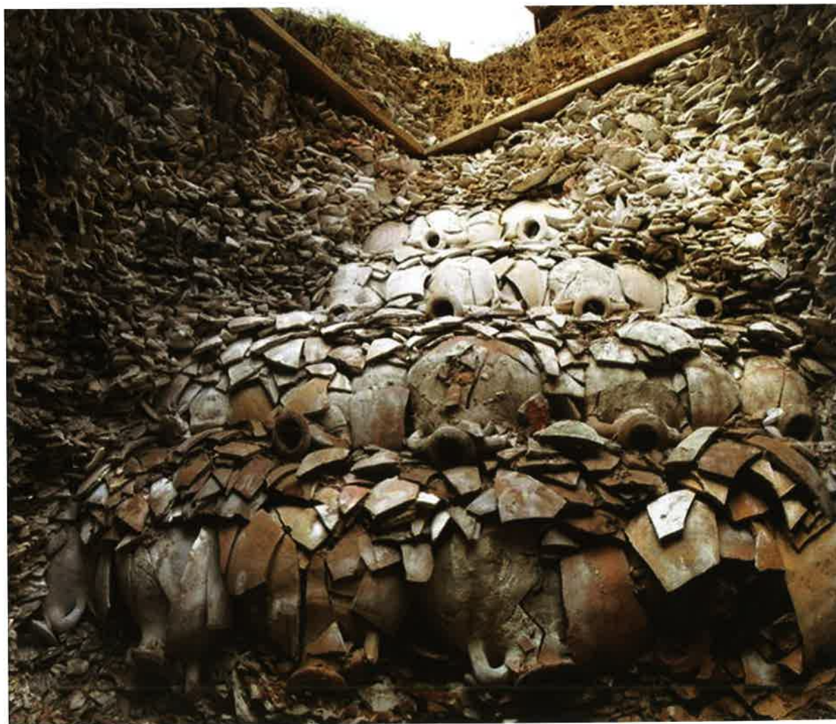
Sistema de construcción del Testaccio mediante muros hechos con las mismas ánforas, tras las cuales, en este caso, se depositaron materiales de los años 205 a 221 d.C. El muro fue recubierto más tarde con materiales de los años 228, 229 y 230 d.C.

Las excavaciones en el monte Testaccio han adquirido una gran relevancia internacional debido a que, de haber sido un simple vertedero de ánforas, se han conservado las inscripciones que, a modo de etiquetas, llevaban las ánforas pintadas con tinta negra. En ellas se hace constar la tara del vaso, el peso del contenido neto, el nombre del comerciante y, además, una etiqueta fiscal en la que consta el distrito desde el que se expidió el ánfora, la confirmación del peso neto, a veces el nombre del lugar preciso del embarque, los nombres de los agentes que intervinieron en la operación y el año de expedición del ánfora.