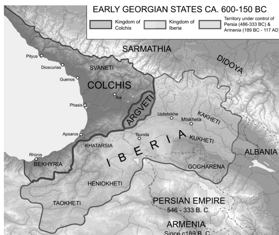
Situación del reino de la Cólquide.

La antigua región caucásica de la Cólquide es conocida ante todo por la mitología griega, debido a que en ella se encontraba el vellocino de oro, un regalo de los dioses que proporcionaba prosperidad a quien lo poseyera. Esto originó la expedición de Jasón y los Argonautas, episodio que ha sido llevado reiteradamente al cine con gran éxito.