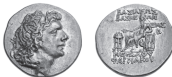
Estátera de oro de Farnaces II del año bosporano 247 (51/50 a.C.) (MacDonald 186/2)

cia. 22 Por desgracia, no tenemos más datos acerca del nombramiento de Aristarco como dinasta. Por ello, podría tratarse también del año 53/52 a.C. 23 o del año 51/50 a.C. Nosotros consideramos que Aristarco sería nombrado en la fecha más temprana, por lo que la presente acuñación se habría realizado en el año 53/52 a.C., quizás en relación con la acuñación por parte de su vecino Farnaces II de estáteras de oro (HGC 7 198), con objeto de manifestar que Aristarco era el gobernante efectivo de la Cólquide, frente a las pretensiones del hijo de Mitridates VI, que finalmente éste llevó a cabo y presumiblemente significó el fin de Aristarco.