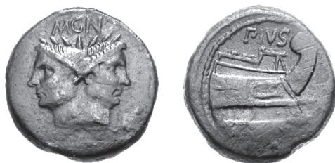
As de Sexto Pompeyo emitido en Sicilia a finales de la década de los años 40 a.C., en la que Jano presenta los rasgos de su padre, Pompeyo Magno (RRC 479/1)

Pero la cosa no está tan clara. Tsetskhladze, que en un primer momento señalaba que la cabeza del anverso era la propia representación de Aristarco, luego considera que en realidad es la figura de Helios, la personificación del sol, con los rasgos de Pompeyo Magno, lo que indicaría que la naturaleza del poder de Aristarco en la Cólquide no habría cambiado transcurridos doce años de su ascensión al gobierno. 17 Muy posiblemente estemos ante la representación del citado dios, con los rasgos del general romano, un anticipo de lo que a finales de los años cuarenta del mismo siglo efectuará Sexto Pompeyo, hijo menor de Pompeyo Magno, con su padre, que lo representará en sus monedas de bronce como el dios Jano (RRC 479/1).