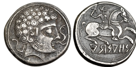
Denario de Arsaos (ACIP 1655 = CNH Arsaos 14)

Asimismo, A. A. Jordán nos ha comunicado verbalmente que Arsaos ha sido al parecer localizada en Campo Real (Sos del Rey Católico, prov. de Zaragoza) 27 , lo que deja fuera de lugar cualquier debate sobre la identidad Arsaos = Calagurris . Ya en su momento Fatás había ubicado este taller en la cercana Sofuentes (Sos del Rey Católico, prov. de Zaragoza) 28 .