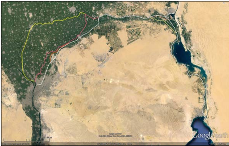
Fig. 3. Imagen actual del delta del Nilo con diversas interpretaciones del trazado .

Con la invasión de Palestina y la sumisión de Jerusalén por parte de Neco II (610-595 a.C.), Egipto fijó su frontera septentrional en el Éufrates y procurándole el vasallaje de otros