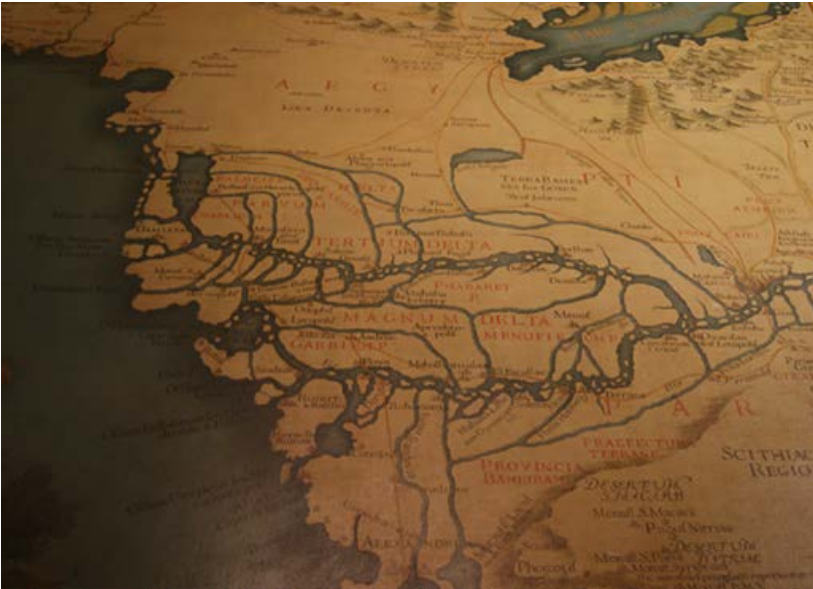
Fig. 4. Imagen del delta del Nilo. Salle delle Mappe, Palazzo Ducale de Venecia. Giovanni Ramusio, Giovanni Domenico Zorzi y Giacomo Gastaldi, ca. 1540.

Pronto el deterioro de la vía hizo impracticable su uso. En esta línea, los costes vinculados a su mantenimiento continuaron hasta época de la conquista arabo-musulmana de Egipto, cuando la administración ‘Umar b. ‘Abd al-‘Azîz, como comenta J. Suné: “Dudo que este estado que intentaba economizar sus ingresos fiscales y que se veía incapaz de incrementar sus efectivos militares pudiese destinar recursos al mantenimiento y limpieza de una obra inmensa que unía el río Nilo con el Mar Rojo. A principios del siglo XIX la limpieza del canal de al-Khatâtba