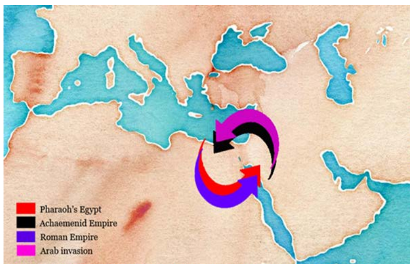
Fig. 5. Dirección del tráfico comercial del canal según la potencia dominante.

requería la mano de obra de 30.000 trabajadores durante cuarenta días (Redmount 1995, 134). Es un esfuerzo que, tal como afirma C. A. Redmount (1995, 135), sólo podían realizar estados fuertes y centralizados. Si antes del califato de ‘Umar b. ‘Abd al-‘Azîz el canal sólo se utilizaba de forma intermitente, después de él, con la generalización de los problemas, debió de ser abandonado a su suerte, dando plena verosimilitud al testimonio de Ibn ‘Abd al-Hakam. Seguramente la decisión del califa Abû Dja‘far al-Mansûr fue menos trascendente de lo que algunas fuentes han querido ver y simplemente se limitó a confirmar un estado de cosas que ya se habían empezado a originar varios años antes” 39 .