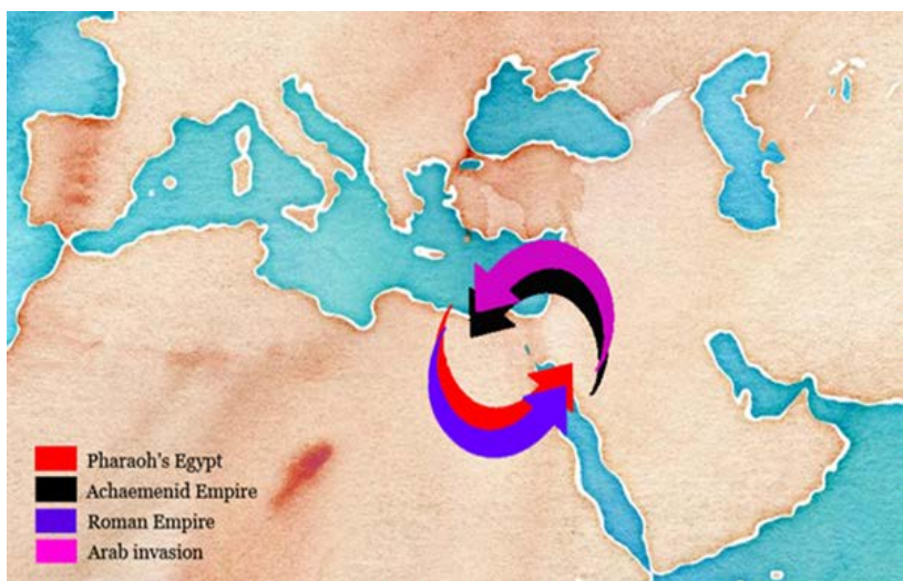
Fig. 5. Dirección del tráfico comercial del canal según la potencia dominante.

requería la mano de obra de 30.000 trabajadores durante cuarenta días (Redmount 1995, 134). Es un esfuerzo que, tal como afirma C. A. Redmount (1995, 135), sólo podían realizar estados fuertes y centralizados. Si antes del califato de ‘Umar b. ‘Abd al-‘Azîz el canal sólo se utilizaba de forma intermitente, después de él, con la generalización de los problemas, debió de ser abandonado a su suerte, dando plena verosimilitud al testimonio de Ibn ‘Abd al-Hakam. Seguramente la decisión del califa Abû Dja‘far al-Mansûr fue menos trascendente de lo que algunas fuentes han querido ver y simplemente se limitó a confirmar un estado de cosas que ya se habían empezado a originar varios años antes” 39 .