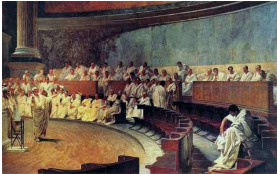
“Cicerón denunciando a Catilina”, cuadro de Cesare Maccari (1880)

«Desde allí se reunió con Murena en la Galia, provincia en la que redactó los testamentos de los muertos, mató a jóvenes huérfanos y estableció con numerosos complicados alianzas y asociaciones criminales» ( Cic. Har. Resp. 42).