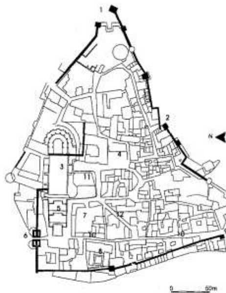
Figura 6. Planta de la Força Vella amb indicació de la muralla romana coneguda. 1, Torre Gironella; 2, Portal Rufi; 3, Catedral; 4, Plaça dels Lledoners; 5, Escalles de la catedral; 6, Portal de Sobreportes; 7, Pla Almoina; 8, Institut Vell (Museu d'Història de la Ciutat); 9, Portal de l'Onyar; 10, Carrer de la Força; 11, Plaça dels Apòstols; 12, Escalles de la Pera.

e) Una prueba complementaria es que mediante diversas prospecciones y sondeos, no aparece cerámica indígena anterior a la conquista romana. Es posible que hubiera existido en este lugar un pequeño núcleo, pero no hay ningún indicio arqueológico anterior al año 100 a.C.