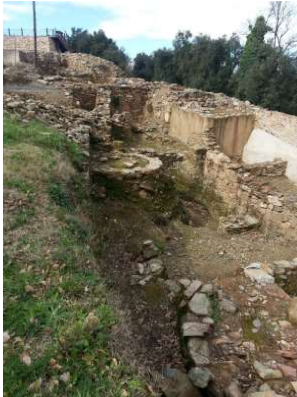
Poblado ibérico de Sant Julià de Ramis (Wikipedia)

simple ruta entre Hispania e Italia, ubicada en «el otro extremo del mundo» (Cic. Mur. 89), donde los únicos puntos seguros eran Massalia (Marsella, dept. Bocas del Ródano), “bañada por las olas de la barbarie” (Cic. Flacc. 63) y Narbo , «atalaya y baluarte del Pueblo Romano» (Cic. Font. 13).