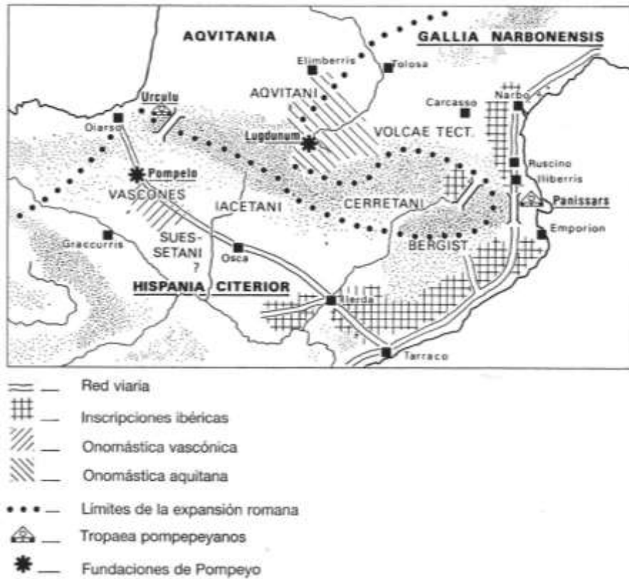
Pompeyo y los Pirineos (según F. Beltrán Lloris y F. Pina Polo)

presenta unas características muy homogéneas 7 . Por ello, La Selva y el Gironès serían parte del territorio de los Indigetes 8 , mientras que los Ausetanos ocuparían las actuales comarcas de Osona y el Ripollès 9 , a un lado y otro del Montseny y Les Guilleries. La explicación sobre la ubicación de Gerunda entre los Ausetanos por Ptolomeo puede obedecer a múltiples causas 10 , de las cuales nosotros preferimos que el autor greco-egipcio utilizó para la elaboración de su trabajo un documento de carácter administrativo-fiscal, que podría explicar las diversas incongruencias que se encuentran en su “Geografía” 11 .