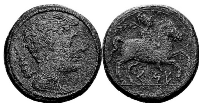
Unidad ACIP 1141 = CNH Kese 34

Esta serie, en cuanto a su anverso, es una imitación tosca y evolucionada de la moneda de la ceca de Kese (Tarragona, prov. Tarragona) con símbolo clava (emisión 11ª de García-Bellido y Blázquez, ACIP 1141-1145 = CNH 34-38, vid infra imagen), 10 a la que se le añade una mano; presenta en lugar de una inscripción ibérica una leyenda griega como indicativo del taller responsable de su emisión. Sea como fuere, Baeterrae es un topónimo de origen ibérico. 11