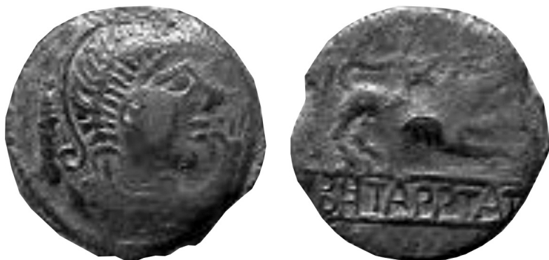
Bronce con variante de leyenda: BHTAPPTATIC (x2)

No hay muchos elementos que permitan ayudarnos al tema de la datación de estas piezas, aunque su asociación con piezas que se encuentran sobre todo en el siglo I a.C., como puede observarse en las excavaciones de Mailhac (dept. Aude), Ensérune (Nissan-lez-Ensérune, dept. Hérault) y Monfó (Magalas, dept. Hérault). 18