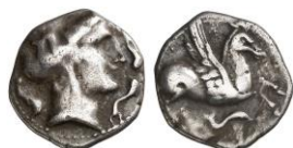
ACIP 220 = CNH 70. AR. Dracma. 16/17 mm (11 ejemplares) 18 . Símbolo delfín grande. Anv.: Similar al anterior. Rev.: Similar al anterior, pero símbolo delfín grande.