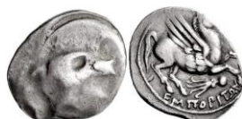
ACIP 216 = CNH 73. AR. Dracma. 16/17 mm (4 ejemplares) 14 . Símbolo pulpo. Anv.: Similar al anterior. Rev.: Similar al anterior, pero símbolo pulpo.