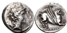
ACIP 212 = CNH -. AR. Dracma. 16/17 mm 10 . Anv.: Similar al anterior. Rev.: Similar al anterior. Leyenda recta.