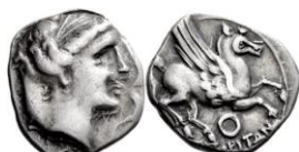
ACIP 217 = CNH 68. AR. Dracma. 16/17 mm (7 ejemplares) 15 . Símbolo círculo. Anv.: Similar al anterior. Rev.: Similar al anterior, pero símbolo círculo.