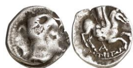
ACIP 214 = CNH 66. AR. Dracma. 16/17 mm (5 ejemplares) 12 . Símbolo A. Anv.: Similar al anterior. Rev.: Pegaso con cabeza modificada a dra. Debajo, inscripción griega ΕΜΠΙΟΠΙΤΩΝ. Entre leyenda y pegaso, símbolo A.