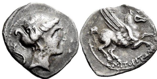
Dracma ligera de Emporion ACIP 224 (ampliado x 2)

En un momento del siglo II a.C. difícil de precisar, Emporion reemprende sus emisiones de dracmas pero ahora con un peso todavía más ligero, quizás bajo el mismo impulso de algunas emisiones de denarios ibéricos del NE. La ceca continuará con sus emisiones hasta que a fines del siglo II a.C., se ve necesitada de acuñar un fuerte volumen de dracmas de forma apresurada y descuidada (a partir del Gripo VI C-D de Amorós), como reflejan los tesoros de Cartellà, Sant Llop, Segueró y La Barroca, y que ya hemos mencionado. Los últimos cuños del tipo Amorós VII y VIII parecen volver a utilizarse a principios del siglo I a.C., a tenor de los hallazgos de Oristà y Alt Empordà 70 .