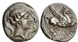
ACIP 224 = CNH 77 (Amorós VII). AR. Dracma. 16/17 mm 22 . Anv.: Cabeza femenina a dra. de tamaño pequeño, cuello largo y estrecho, alrededor tres delfines. Rev.: Pegaso con cabeza modificada a dra. Debajo, inscripción griega ΕΜΠΙΟΡΙΤΩΝ.