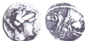
ACIP 213 = CNH -. AR. Dracma. 16/17 mm. 4,23 g (2 ejemplares) 11 . Anv.: Similar al anterior. Rev.: Similar al anterior, pero pegaso a la izq.