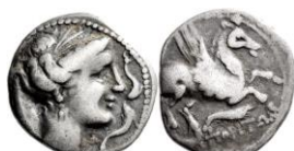
ACIP 219 = CNH 75. AR. Dracma. 16/17 mm (6 ejemplares) 17 . Símbolo langostino. Anv.: Similar al anterior. Rev.: Similar al anterior, pero símbolo langostino.