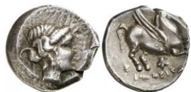
ACIP 226 = CNH 79. AR. Dracma. 16/17 mm (11 ejemplares) 24 . Símbolo abeja. Anv.: Similar al anterior. Rev.: Similar al anterior, pero símbolo abeja.