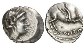
ACIP 225 = CNH 78. AR. Dracma. 16/17 mm (13 ejemplares) 23 . Dos puntos. Anv.: Similar al anterior. Rev.: Similar al anterior, pero entre pegaso y leyenda dos puntos.