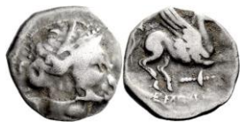
ACIP 221 = CNH 67. AR. Dracma. 16/17 mm (10 ejemplares) 19 . Símbolo antorcha. Anv.: Similar al anterior. Rev.: Similar al anterior, pero símbolo antorcha