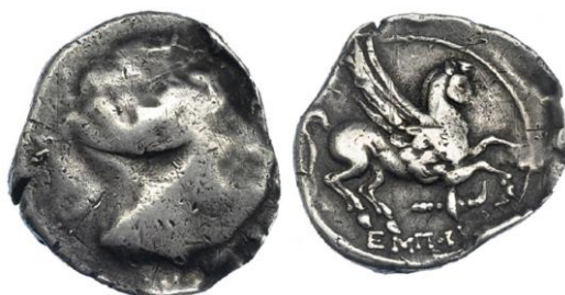
Dracma ligera de Emporion ACIP 221 (ampliado x 2)

Si bien desde un punto de vista metalográfico la plata continuó siendo de gran pureza y con valores medios muy semejantes a los de periodos anteriores, pero la presencia de elementos minoritarios, sobre todo cobre y plomo, es mucho más irregular. Es posible que las técnicas metalúrgicas de fundición y refinamiento del metal que se efectuaban en este momento fueran menos cuidadas que las utilizadas para las emisiones de dracmas del siglo III a.C. De esta forma, Emporion sigue utilizando la misma ley, pero sin obtener la misma regularidad que en las emisiones precedentes 48 .