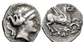
ACIP 218 = CNH 72. AR. Dracma. 16/17 mm (15 ejemplares) 16 . Símbolo Victoria con corona. Anv.: Similar al anterior. Rev.: Similar al anterior, pero símbolo Victoria con corona.