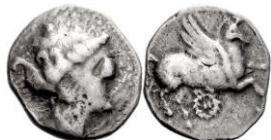
ACIP 222 = CNH 69. AR. Dracma. 16/17 mm (18 ejemplares) 20 . Símbolo corona. Anv.: Similar al anterior. Rev.: Similar al anterior, pero símbolo corona