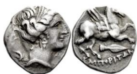
ACIP 223 = CNH 74. AR. Dracma. 16/17 mm (14 ejemplares) 21 . Símbolo punta de lanza. Anv.: Similar al anterior. Rev.: Similar al anterior, pero símbolo punta de lanza