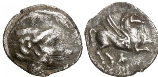
Dracma ligera de Emporion ACIP 226 (ampliado x 2)

Si bien es cierto que en este periodo temporal la moneda de Roma domina el NE. de la Península Ibérica, Emporion , una ciudad libre al menos sobre el papel, podría acuñar moneda según el patrón metrológico que considerara necesario. Este numerario de plata quizás fue efectuado por razones de prestigio o para acentuar su independencia, en un momento en que los romanos se habían anexionado la vecina Galia Transalpina (121 a.C.) 81 . Por tanto, no estaríamos frente a un fenómeno de tipo económico sino político, independiente de la presencia abrumadora del denario romano en el territorio y de la no fabricación de denarios ibéricos en la región. En este sentido, hay que destacar que cinco de las variantes de dracmas emporitanos tienen como símbolo la corona, sola o acompañada (en un caso, con la Victoria) (ACIP 218, 222, 232, 234 y 237): ¿reflejo de las victorias romanas en el campo de batalla (en la Galia meridional y luego en