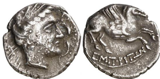
Dracma ligera de Emporion ACIP 210 (ampliado x 2)

Los cuños de los Grupos V, VIA y VIB se graban con cuidado con lo que se producen ejemplares de calidad, pero ya con el Grupo VI C-D el arte pierde delicadeza. A la vez que se introduce en diversos reversos una novedad: la utilización de símbolos o letras, como: un círculo, un delfín, una clava, una punta de lanza, una mosca, un pulpo, una antorcha o una punta de lanza, más las letras alpha y delta 44 ; este hecho muy posiblemente se deba por la influencia de las primeras series de denarios romanos, en las que la identidad de los magistrados monetales se representó mediante símbolos y letras.