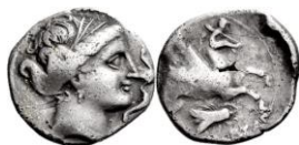
ACIP 215 = CNH 71. AR. Dracma. 16/17 mm (3 ejemplares) 13 . Símbolo mosca. Anv.: Similar al anterior. Rev.: Similar al anterior, pero símbolo mosca.