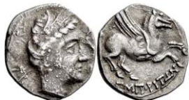
ACIP 210 = CNH 64 (Amorós Vb). AR. Dracma. 16/17 mm 8 . Anv.: Similar al anterior. Estilo diferente. Rev.: Similar al anterior.