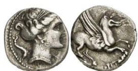
ACIP 211 = CNH 65 (Amorós VIBa). AR. Dracma. 16/17 mm 9 . Anv.: Similar al anterior. Estilo diferente. Rev.: Similar al anterior.