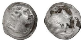
Dracma ligera de Emporion incusa (Cores 133) 47

De esta forma, la técnica de acuñación va empeorando hasta llegar a ser de pésima calidad. Algunos cuños de anverso fueron utilizando hasta su desgaste casi total mientras se combinaban con nuevos cuños de reverso, los flanés eran irregulares y la acuñación no se asemejaba precisamente a lo que cabría esperar de una ceca griega. Las últimas series de Emporion han perdido completamente la belleza de sus primeras dracmas 46 .