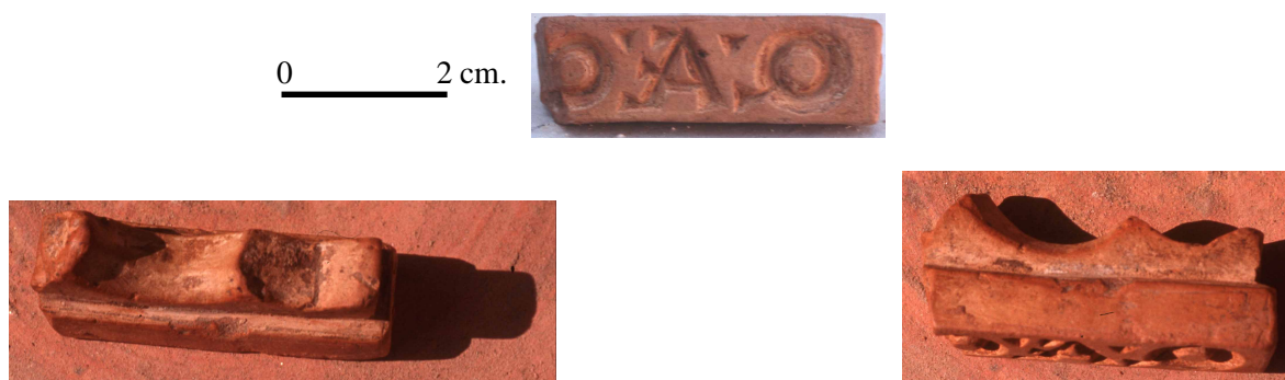
Lámina I.- Matriz hallada en La Catria (Lora del Río, Sevilla).

Considero matriz diversa a todos aquellos sellos que se diferencian por cualquier elemento: medidas del cartucho, relieve de las letras, incisas o excisas, dirección de la escritura, forma, dirección y tamaño de las letras, elementos de puntuación o decoración etc. En definitiva todo elemento que nos permita decir que una impronta es distinta de otra 44 . Recientemente se ha hallado una matriz del sello QAEO[--- en la Catria (Lám.I) 45 , lugar donde habíamos encontrado numerosas variantes de este sello 46 . La matriz hallada no se corresponde con ninguno de los sellos hasta ahora encontrados en La Catria.