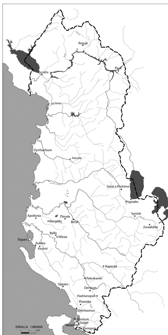
Figure 1. Diffusion des sigillées en Albanie.

En Albanie, les sigillées sont mentionnées pour la première fois en 1919, par C. Prasn timer et A. Schober, découvertes à Petrelë et Margëlliç 1 . Léon Rey en 1925, dans ses chapitres consacrés aux fouilles d' Apollonia et Durrës (fig. 1), mentionne plusieurs découvertes 2 . Pour le site d' Apollonia , il présente une photographie avec différents objets, sur laquelle il est possible de distinguer les sigillés italiques, types Conspectus 18 ou 20, avec appliques. Il mentionne aussi différentes estampilles, mais n'en donne aucun dessin. Dans la même publication, il évoque la découverte de sigillées à Durrës, lors de fouilles près de l'ancienne préfecture (fig. 2, n° 1).